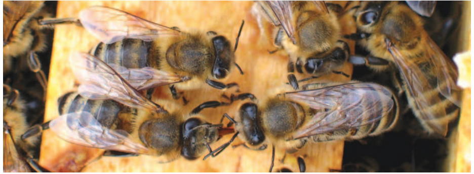
Bis zu 40-mal wandert der Nektar von Biene zu Biene (links die Nehmende mit ausgestrecktem Rüssel) gereicht, der Nektar dabei eingedickt und mit Enzymen angereichert.

Im Bienenstock ist Honig nach kurzer Bearbeitungszeit stets verlässlich guter