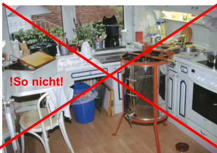
Abb.5a + 5b.

● am 10. Juni: z.B. Bildung eines Begegnungsablegers mit Bienen, Futterwabe und frisch geschlüpfter Königin (oder Bildung eines Brutwabenablegers mit viel verdeckelter und wenig jüngster Arbeiterinnenbrut 10 Tage vorher, also am 31.Mai). Bei seiner Erstellung wird der Ableger in 3 km Entfernung aufgestellt.