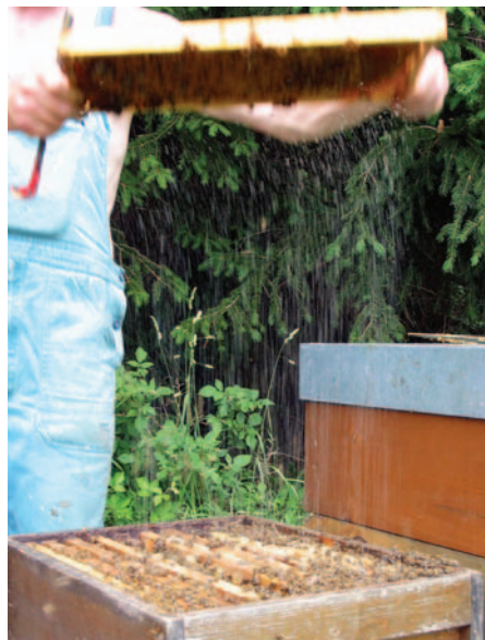
Abb.1.: Wenn es aus der Wabe „tropft“, Ernte verschieben!”

Dagegen sind andere Maßnahmen der Völkerführung, Enghalten, die Fluglochgröße, eine Belüftung einzelner Zargen durch Löcher, ein offener Gitterboden, oder eine Folie unter dem Deckel ohne Einfluss auf die Honigfeuchte.