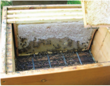
Abb.2a: Wer mit Absperrgitter arbeitet, hat nie Brut im Honigraum und damit erleichterte Honigernte und -entdeckung.

Verdeckelung kann vollständig ausgereiften Honig anzeigen, herrscht jedoch anhaltend Massentracht stimmt weder die Regel: „Verdeckelter Honig ist reif.“ noch „Auf Nummer Sicher geht, wer nur Honigwaben erntet, die zu zwei Dritteln verdeckelt sind“.