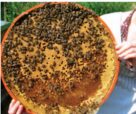
Abb. 5: Die Drehbeute mit Rundwaben sollte durch tägliches „Auf den Kopf drehen“ der Brutzellen die Fortpflanzung von Varroa unterbinden. Dies funktioniert leider nur in der Vorstellungswelt der Hersteller.

Drohnenbrutentnahme plus Ameisen- und Oxalsäure, so einfach kann effiziente Varroa-Bekämpfung sein! Doch nicht nur wir Imker säßen heute noch auf den Bäumen, wären wir nicht ständig auf der Suche nach neuen Methoden. Die Milbe kann einem fast leid tun, sollte sie doch je nach Ideengeber schon durch pflanzliche Inhaltsstoffe aus Tabak, Neem, Kapuzinerkresse, Wurmfarn oder Fichtennadelölen vergiftet, unter Wasser (auf ihrer Biene!) ersäuft, von „bereits resistenteren“ Bienen gezielt ge„killt“, durch tägliche Drehung von Rundwaben um 180° um ihre Fortpflanzung gebracht (Abb.5), von elektromagnetischen Feldern, Ultraschall, Schall oder „abwehrenden Informationen“ auf Metallplättchen vergraut, durch Platzmangel in kleinen Zellen oder Zerdrücken im Rollenboden ausgerottet werden. Manch tatsächlich wirksamer Technik wie dem Einsatz von Wärme oder Puderzucker (Abb.6a und b) mangelt es eminent an Praxis-tauglichkeit. Lockstoffen gelingt es im Volk bisher nicht, die Milben „an der Nase herum zu führen“. Natürliche