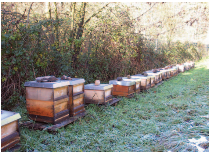
Abb. 2: Winterfertiger Ablegerstand im Oktober. In den nächsten 150 Tagen fallen hier maximal 20 Minuten Arbeitszeit an.

unzuverlässige Methoden der Varroabekämpfung setzte, der muss schon jetzt die ersten Notbremsen ziehen. Noch fehlender Futtermittel sollte dabei möglichst bienennah angeboten werden.