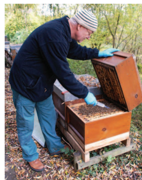
Abb. 4: Oxalsäure tröpfeln in die Wintertraube: Eine Minute Arbeit für den Imker, fast milbenfreies Neujahr für die Bienen.

7. Die durch OS vergifteten Milben fallen bis zu 5 Wochen lang. Bei Interesse am Behandlungserfolg Windeln solange eingeschoben lassen. Fallen insgesamt mehr als 1000 Milben, hat zwar die OS-Behandlung gut gewirkt, trotzdem besteht akute Gefahr für die Überwinterung. Denn die Bienen sind zwar nun milbenfrei, durch ihr Aufwachsen mit dem Parasiten jedoch meist so geschädigt, dass ihr Leben nur kurz währt. Wo durch OS viele Milben fallen, sollte un-