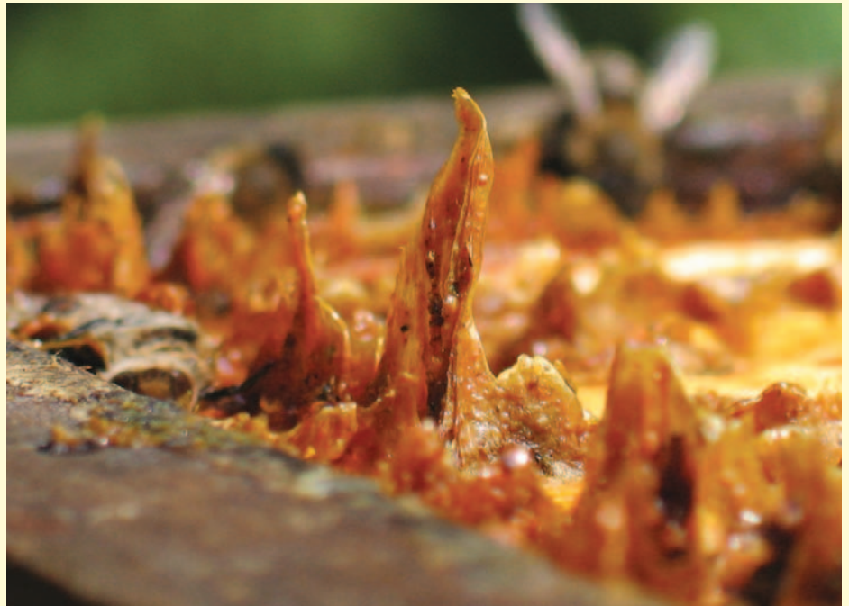
Tür zu – es zieht! Als Vorbereitung auf die kalte Jahreszeit verrammelt manches Volk jede Ritze mit reichlich Propolis.