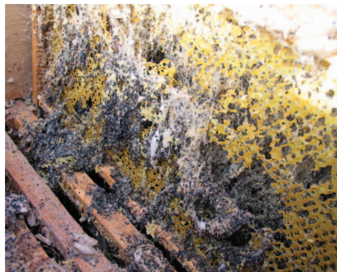
Abb.8: Nur auf bebrüteten Waben können sich Wachsmotten zu dicken Maden entwickeln. Sind die bebrüteten Waben aufgefressen, richten sie dann voller Hunger auch auf unbebrütetem Wabenwerk ein Schlachtfeld an.

Die einwandfreie Qualität unserer Bienenprodukte wird nur in Ausnahmefällen durch Pestizide aus der Landwirtschaft und Umweltschmutzung beeinträchtigt. Hauptkontaminationsquelle war und ist der Imker mit der Anwendung fettlöslicher Akarizide, Pestizide zur Wachsmottenkontrolle (z.B. „Imker-Globol“) oder Repellentien statt Rauch bei der