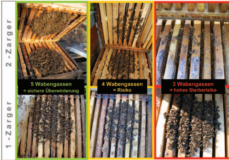
Abb.1 Sind meine Völker stark genug für den Winter? Jung- und Wirtschaftsvölker brauchen zu Winterbeginn Anfang November mindestens 5.000 Bienen. Nur dann ist eine optimale Temperatur in der Wintertraube gesichert, auch harte Winter werden so schadlos überstanden. Die Zahl der besetzten Wabengassen ermittelt man am sichersten, indem man nach einer kalten Nacht (unter 5 °C) am frühen Morgen jede Gasse zählt, in der einige Bienen (mehr als zehn) zu sehen sind und an dieser Zahl zwei abzieht. Grünes Licht: Besetzen Ihre Völker fünf Wabengassen, können Sie den Deckel beruhigt wieder schließen. Gelbes Licht: Vier besetzte Wabengassen sind unter den beschriebenen Bedingungen das absolute Mindestmaß. Rotes Licht: Völker, die zu Winteranfang auf drei Wabengassen sitzen, haben ein hohes Sterberisiko.