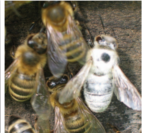
Abb. 6 a und b: Bienen von den Waben fegen und mit Puderzucker durchschütteln...das veranlasst tatsächlich einige Milben zum loslassen. Leider jedoch nicht ausreichend viele.

Feinde aus der Welt der Bakterien, Viren, Pilze, Fadenwürmer und Pseudoskorpione sind verheißungsvolle, jedoch bisher nicht ausreichend erforschte Ansätze. Mit Sicherheit KEINE Zukunft hat jedoch die „harte Chemie“, wie sie in Bayvarol, Perizin & Co. vertreten ist.