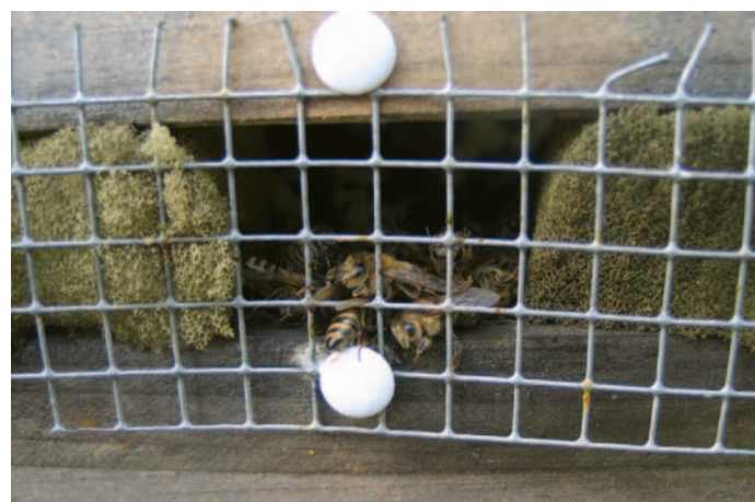
Abb. 3a und b: Mäusekeil oder Mäusegitter, das ist hier die Frage... Deutlich weniger Arbeit macht das Gitter.

Dazu zwei unbesetzte Randwaben entnehmen und z.B. Tetrapaks (siehe DNB 06/2010 S.189) mit leicht zu verarbeitendem Futtersirup an den Bienensitz stellen.